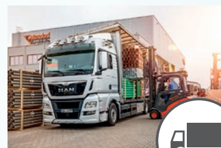
Transport der Ware